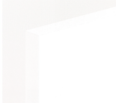
四方木口貼り仕様